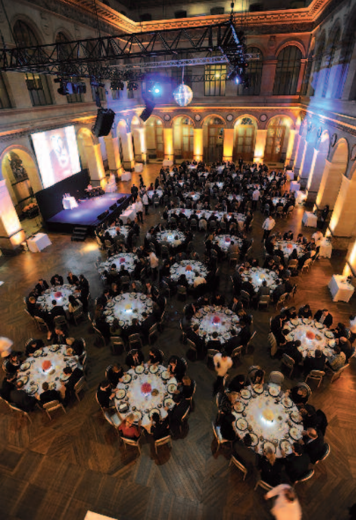
Les convives à tables dans la Nef.

bénéficient d'une forte valeur ajoutée". Sa conclusion ? Qu'il reste "beaucoup à faire"... mais qu'il y a de quoi être "optimiste et confiant", et qu'il ne faut pas oublier que chaque jour en France, "75 000 Français travaillent pour une entreprise à capital suédois" !