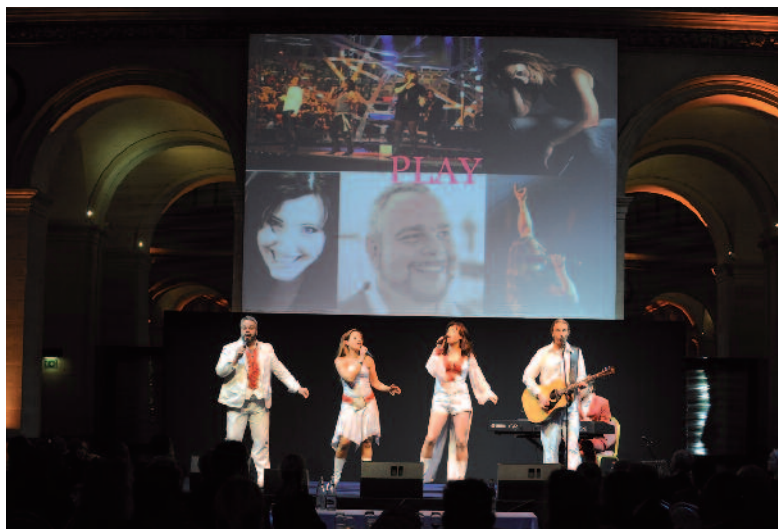
Le groupe suédois PLAY.

groupe pop. Un hommage musical proposé par les quatre chanteurs du groupe suédois Play revisitant les tubes de Björn Ulveaus et Benny Andersson. Avec quelques étonnants clins d’œil, telle cette interprétation de la reprise en français de “The winner takes it all” par Mireille Mathieu... une chanson devenue au passage “Bravo tu as gagné”. Bravo, oui. Aux entreprises ga-