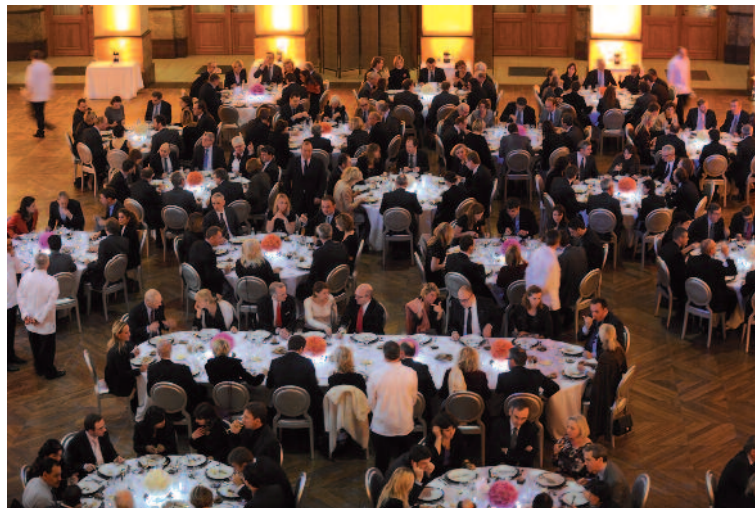
La belle salle de dîner.

niveau, plus la gestion collective devient importante". Et s'il devait comparer les méthodes d'entraînement française et suédoise ? "Le Français est plus direct. Il dira 't'as été nul'. Tandis que le Suédois dira plutôt 't'aurais pu mieux faire...'. Personnellement, je préfère la version française !"