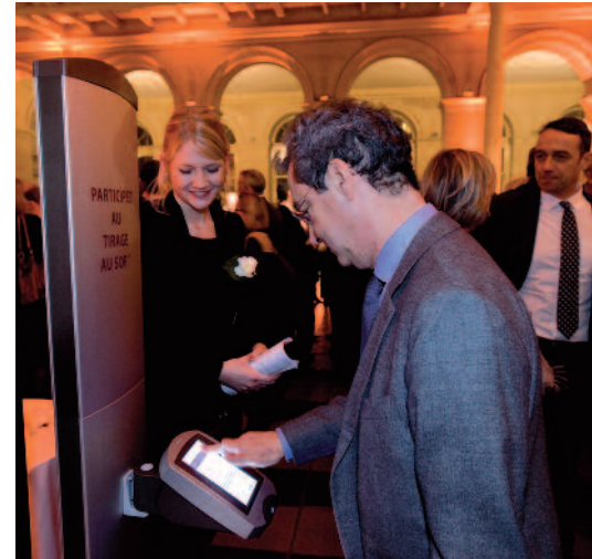
Merci de prendre un ticket à la machine Qmatic pour participer au tirage au sort.

Kim Källström n'a pas manqué, dans un français tout à fait remarquable, de poursuivre le parallélisme entre monde du sport et monde de l'entreprise, constatant par exemple que "plus on est à un haut